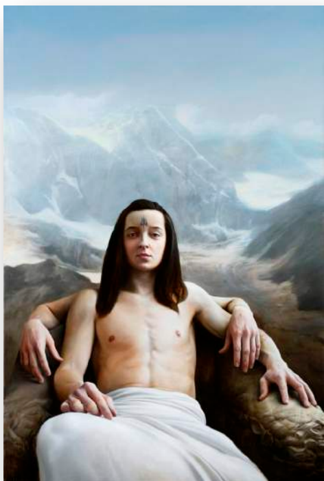
Jan Uldrych: Šiva akryl a olej na plátně 100x150cm

Na co byste se ho zeptali, kdybyste teď měli možnost s ním mluvit?