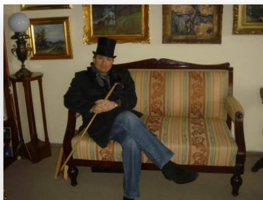
Byl trojský elegán

Stál celou dobu vedle mě, trpělivě čekal a přitom básnil o svém novém úlovku. Zářil, když otevřel kapotu auta a ukázal mi jeho útroby. Přiznám se, dodnes jsem neslyšela zvuk motoru, který by byl více sexy než tento. A vsadím se, že jsem byla jediným spolujezdcem, který v jeho nablýskaném autě seděl v zahradním oblečení a bagančatech, na která se ještě lepila hlína.