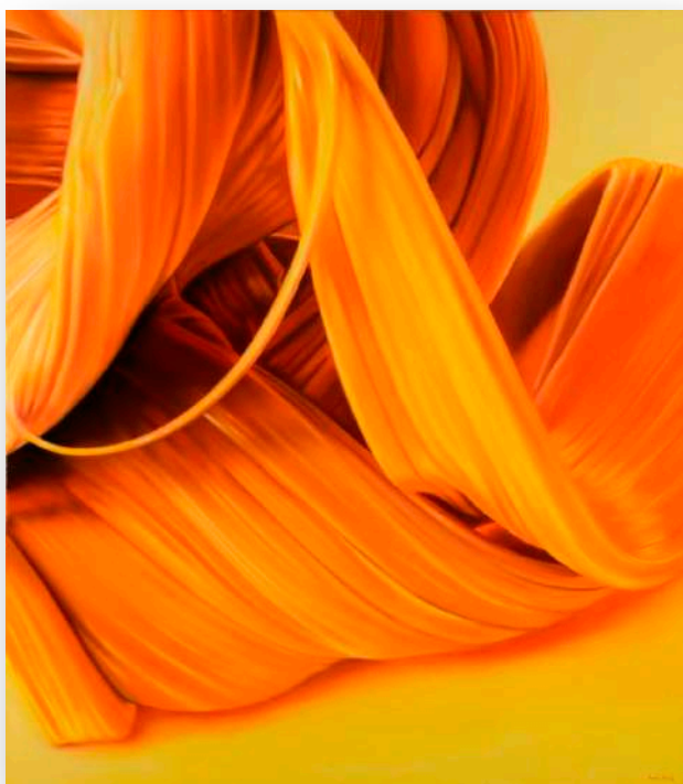
Marek Slavík: Nezvládnutá sebereflexe olej na plátně 200x175cm

Zní to všechno pěkně a jednoduše. Snad právě proto mě zajímá, kde vidí rozdíly mezi svým dřívějším životem v businessu a současným v umělecké oblasti. Odpovídá klidně, bez emocí.