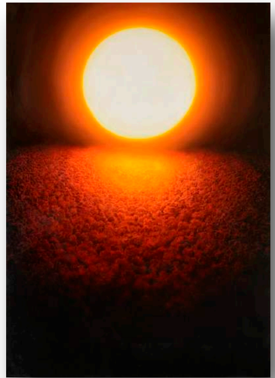
Jan Uldrych: Bez názvu 2011 akryl a olej na plátně 200x150cm

Další články z rubriky SLOW MOMENTS najdete na www.dumcernalabut.cz